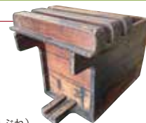
滓槽 (おりぶね) ※丹波杜氏酒造記念館貯蔵品

シンポジウムが行われる平成知新館のグランドロビーにて、酒造りの担い手が所有する、歴史ある酒造道具等の展示を行います。是非ご覧ください。